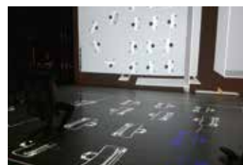
3. Ergonomiestudien und Validierung mit CADwalk ERGO Virtual Reality