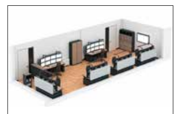
4. Finaler Raumplan