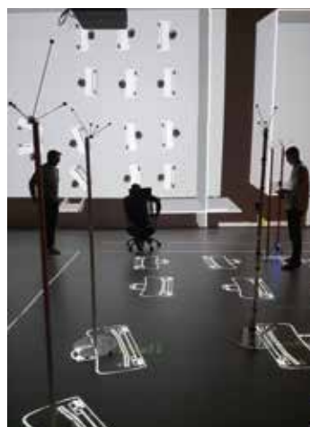
2. Test der Ideen und Entwürfe mit allen Beteiligten